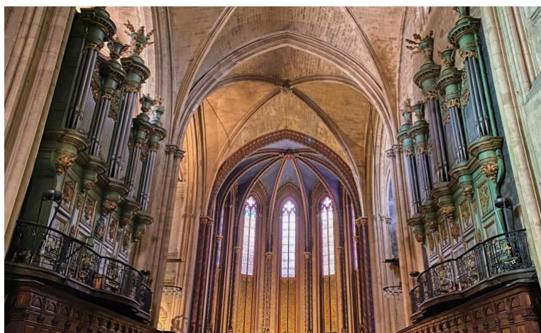
Orgue de la Cathédrale St Sauveur à Aix-en-Provence

« Beaucoup d'entre vous se sont certainement demandé en entendant un orgue dans une église comment cet instrument pouvait produire un son à peine audible et l'instant d'après faire trembler les piliers de la nef par sa puissance. Je vous propose donc d'aller à la découverte du "roi des instruments", de suivre ses transformations des origines à nos jours, de retrouver ses plus grands interprètes et ses plus belles pages. La conférence du 25 novembre sera consacrée à l'orgue de ses origines à 1840, celle du 6 janvier à la période allant de 1840 à demain. De nombreuses photos, vidéos et extraits sonores illustreront mon propos. »