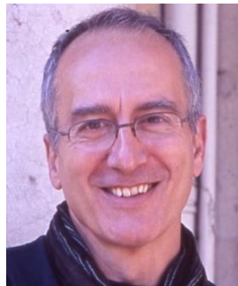
par Georges Zaragoza

« Verdi a été surnommé le roi des chœurs par ses contemporains, une façon de rendre hommage à la richesse musicale de ces "numéros" qui mettent en scène des groupes. Il s'agira alors d'explorer en quoi, ces mêmes chœurs ont été un formidable outil dramaturgie aux mains de l'homme de théâtre qu'était Verdi. »